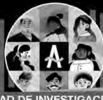
UNIDAD DE INVESTIGACIONES PERIODÍSTICAS