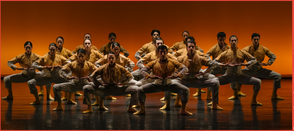
Fotografía de García-Jauregui